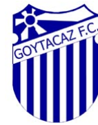
GOYTACAZ CAMPOS (22) 8127-0160