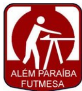
APF ALÉM PARAÍBA