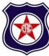
FRIBURGUENSE NOVA FRIBURGO (22) 8813-5211