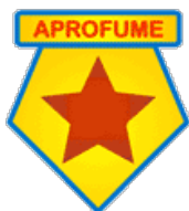
APROFUME DUQUE DE CAXIAS (21) 8659-4307